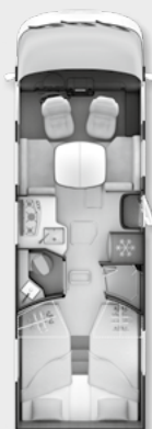
+ ALDE SERIE