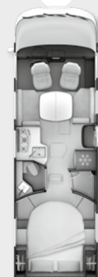
+ ALDE OPTION [E]