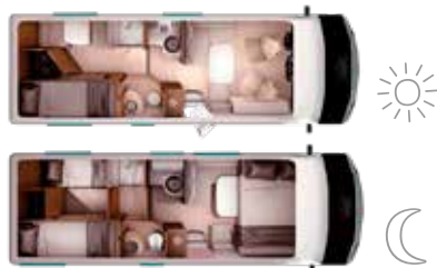
Dag- & nachtindeling van de Itineo SLB 700

aan voorzien, maar standaard wordt hij geleverd met een lichtwerend gordijn dat de hele cabine omhult. Praktisch en gezellig. De geluidsisolatie had voor het rijden beter gekund. Motorgeluiden dringen iets te nadrukkelijk het interieur binnen.