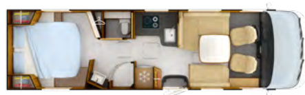
i1090 ALDE SERIE