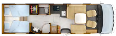
i1066 ALDE SERIE

Attention, il appartient à l'utilisateur d'adapter son chargement et le nombre des passagers embarqués en fonction du PTAC, de la charge utile du véhicule et du poids des équipements complémentaires qu'il a installés ou fait installer.